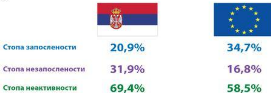
Графикон 24: СТОПЕ ЗАПОСЛЕНОСТИ, НЕЗАПОСЛЕНОСТИ И НЕАКТИВНОСТИ МЛАДИХ У СРБИЈИ И ЕВРОПској УНИЈИ У 2017. у %

Положај младих на тржишту рада јесте побољшан у односу на 2014, када је рађена претходна анкета, али чињеница остаје да је њихов статус "значајно лошији у односу на друге групе на тржишту рада". Они су такође у изразито неповољнијем положају на тржишту рада од младих у Европској Унији. Већи број младих у земљама Европске уније је запослено. Такође, они брже нађу посао од наше омладине. Оно што додатно обесхрабрује јесте чињеница да је управо та старосна група и у Европској унији у лошијем положају од других група становништва.